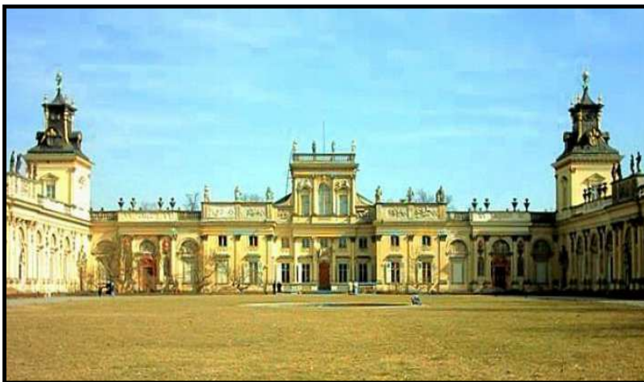
Pałac w Wilanowie