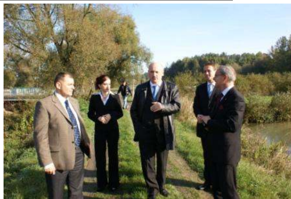
Spotkanie na grobli w Częstoborowicach