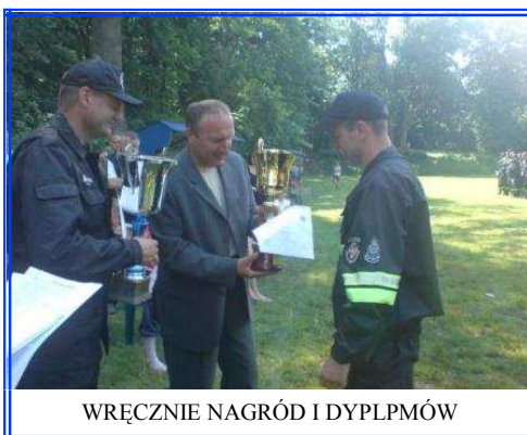
WRĘCZNIE NAGRÓD I DYPLMÓW

Nagrody dla uczestników i zwycięzców zawodów ufundowali wójtowie poszczególnych gmin. Zawody pod względem organizacyjnym przygotowane były na poziomie bardzo dobrym.