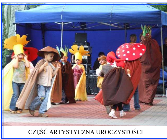
CZĘŚĆ ARTYSTYCZNA UROCZYSTOŚCI