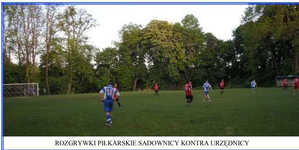
ROZGRYWKI PIŁKARSKIE SADOWNICZY KONTRA URZĘDNICY