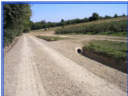
ZAKOŃCZONA ODBUDOWA DROGI - CHOINY

2. Umocnienie dna wąwozu lessowego i odprowadzenie wód opadowych w ciągu drogi wewnętrznej położonej na działce nr 848