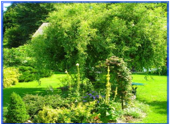
WYRÓŻNIENIE - SUSZEK ALINA