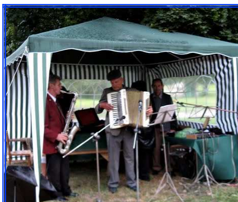
ORKIESTRA PRZYGRYWAJĄCA UCZESTNIKOM ZJAZDU