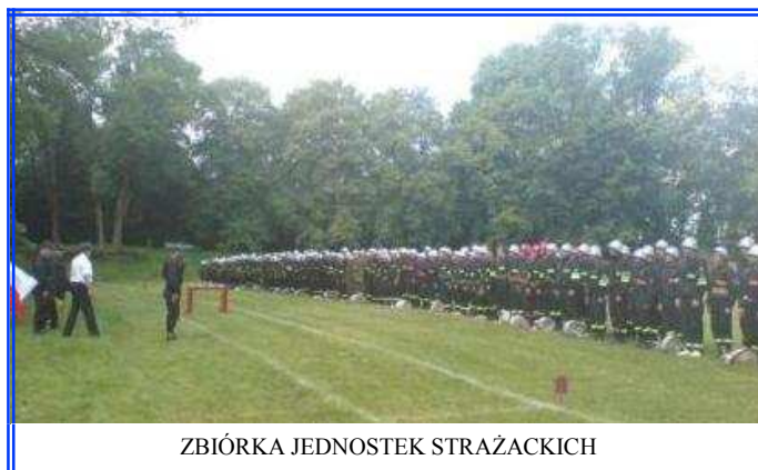
ZBIÓRKA JEDNOSTEK STRAŻACKICH

W zawodach udział wzięło 22 drużyny (w tym jedna kobieca z OSP Pilaszkowice - Bazar). Klasyfikacja końcowa przedstawia się następująco: