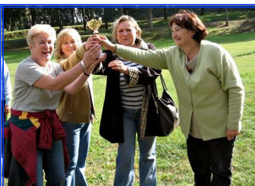
RZUT LOTKĄ O „PUCHAR ZŁOTEGO JABŁKA”