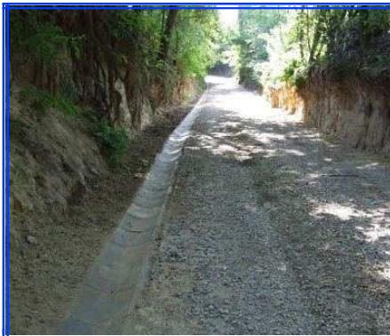
ZAKOŃCZONE PRACE W MIEJSCOWOŚCI PILASZKOWICE DRUGIE

w m. Pilaszkowice Drugie. 94 663,65 zł - udział własny Gminy 200 000 zł - dofinansowanie z Ministerstwa Spraw Wewnętrznych i Administracji