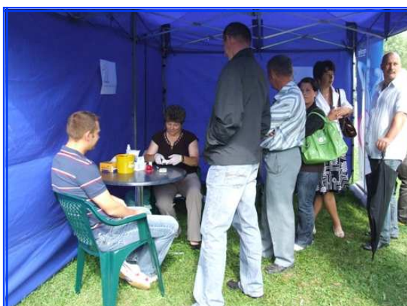
POMIAR CUKRU, CHOLESTEROLU I CIŚNIENIA