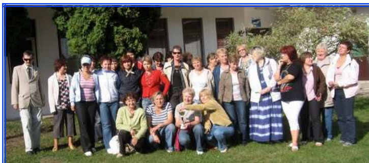
ZDJĘCIE UCZESTNIKÓW ZJAZDU

Przy wspaniałej orkiestrze można było potańczyć i pośpiewać, radości nie było końca. Mimo znakomitej atmosfery panującej na zjeździe nadszedł czas zakończenia spotkania i rozjazd uczestników do domów.