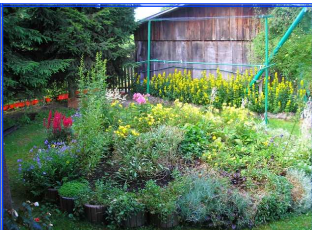
WYRÓŻNIENIE - BANASZKIEWICZ MAŁGORZATA