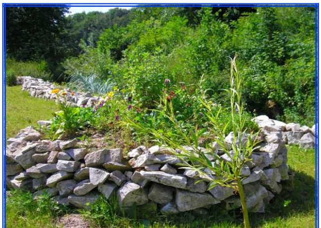
WYRÓŻNIENIE - SIENNICKA IRENA