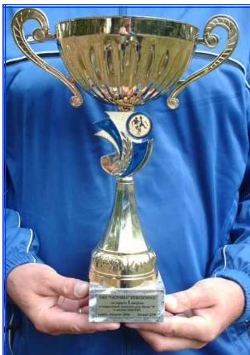
PUCHAR ZA ZAJĘCIE I MIEJSCA W ROZGRYWKACH JUNIORÓW PRZY KLASIE „B” W SEZONIE