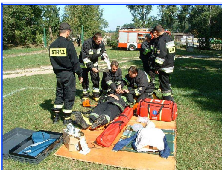
ĆWICZENIA Z ZAKRESU RATOWNICTWA MEDYCZNEGO

Ćwiczenia jednostek OSP KSRG polegały na wykonywaniu przez poszczególne