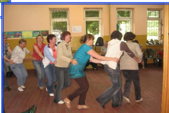
ZA OKNAMI DESZCZ, A W SALI WYŚMIENITA ZABAWA