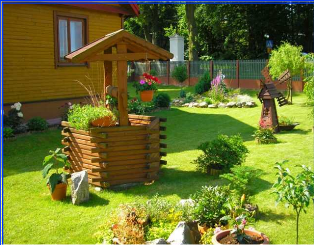
I MIEJSCE - FLOR BOŻENA